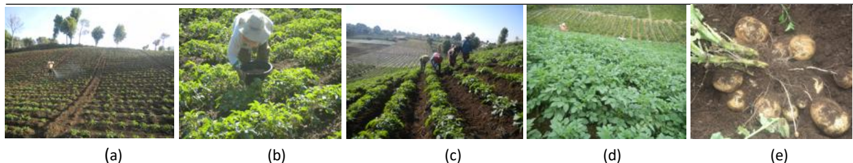
Gambar 2. Tanaman sebelum didangir dan penyemprotan pestisida (a), pemupukan susulan (c), pendangiran/pembuatan guludan memotong lereng (d), tanaman dengan umbi 75 HST (e, f)

dibandingkan populasi tanaman dengan guludan searah lereng (51.000 tanaman/ha). Hal ini menunjukkan bahwa penerapan teknik KTA berdampak pada luas bidang olah yang berarti mengurangi populasi tanaman. Namun produktivitas kentang dengan agroteknologi konservasi masih jauh lebih tinggi dibandingkan dengan sistem tanam petani dengan guludan searah lereng karena didukung oleh varietas tanaman berkualitas (G4, bersertifikat) sehingga pertumbuhan tanaman lebih baik dan lebih tahan terhadap serangan pathogen dengan serangan kurang dari 5 % (Tabel 2).