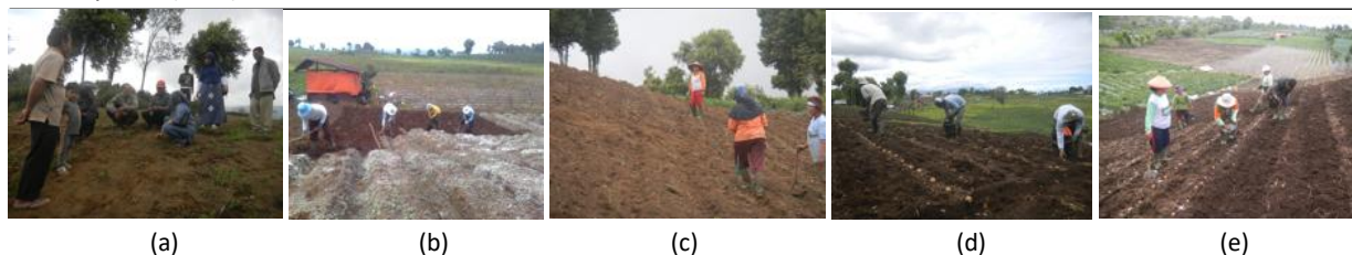
Gambar 1. Diskusi dan penetapan lokasi demplot (a), pengapuran (b), pembuatan garis tanam (c), dan penanaman bibit kentang (e) pada lahan demplot

kentang di atas pupuk kandang pada “garis tanam” dengan jarak antar bibit 25 cm (Gambar 1d). Berdasarkan jarak tanam, diperoleh titik tanam (1 umbi/titik) sebanyak 4891 pada lahan demplot KT-G7 dan 4838 pada lahan demplot KWT-Arimbi, sehingga diharapkan populasi tanaman 4891 dan 4838 pada masing-masing demplot. Pemberian pupuk kimia dilakukan saat tanam secara tugal dengan takaran 300 kg Urea, 400 kg ha, 300 kg SP-36, dan 300 kg KCl per hektar pada lahan demplot KT G7 (dosis anjuran Balitsa, Lembang, Jawa Barat, Duriat et al. , 2006); 150 kg Urea, 150 kg ZA, 350 kg SP-36, dan 200 kg KCl per hektar pada lahan demplot KWT-Arimbi (hasil percobaan). Sebagai pupuk dasar, diberikan setengah dosis. Kemudian dilakukan penutupan bibit dan pupuk menggunakan tanah di sisi bibit dan pupuk tersebut menggunakan cangkul sehingga terbentuk barisan memotong lereng (Gambar 1e).