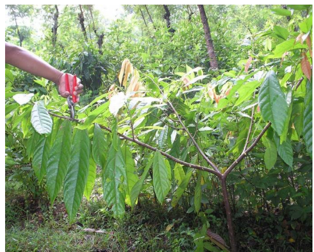
Gambar 2. Pemangkasan pada topping cabang primer