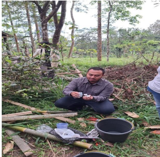
Gambar 4. Pengukuran pH Awal Tanaman Teh

Materi pelatihan menekankan bahwa GAP bukan hanya berkaitan dengan hasil panen, tetapi juga dengan cara kebun dikelola secara rapi, aman, dan konsisten. Peserta diajak memahami bahwa kebun yang tertata akan lebih mudah dipelihara, lebih nyaman digunakan untuk kegiatan belajar, dan lebih menarik bagi pengunjung (Gambar 3). Pendekatan ini penting karena dalam pengembangan eduagrowisata, kualitas kebun tidak hanya dinilai dari produksi, tetapi juga dari kebersihan, keteraturan, dan kemudahan kebun untuk dijelaskan kepada masyarakat umum.