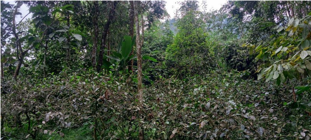
Gambar 2. Kondisi petak kebun yang kurang terawat

Pre-test dilakukan sebelum pelatihan GAP dilaksanakan. Pada sesi ini, borang pertanyaan dibagikan kepada peserta untuk mengukur tingkat pengetahuan awal. Rerata skor peserta digunakan sebagai gambaran kondisi sebelum pelatihan diberikan. Materi GAP tanaman teh disampaikan oleh Yovi Avianto, S.P., M.Sc., dengan fokus pada prinsip