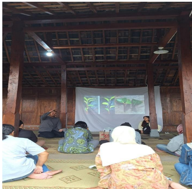
Gambar 3. Pemberian materi terkait GAP Tanaman Teh

budidaya yang mudah diterapkan oleh masyarakat, yaitu sanitasi kebun, pemangkasan dan pemeliharaan tajuk, pengelolaan gulma secara terkendali, pemetikan pucuk yang benar, serta pencatatan kegiatan budidaya. Penyampaian materi dilakukan dengan bahasa sederhana agar mudah dipahami dan langsung dihubungkan dengan kondisi kebun teh di Turgo.