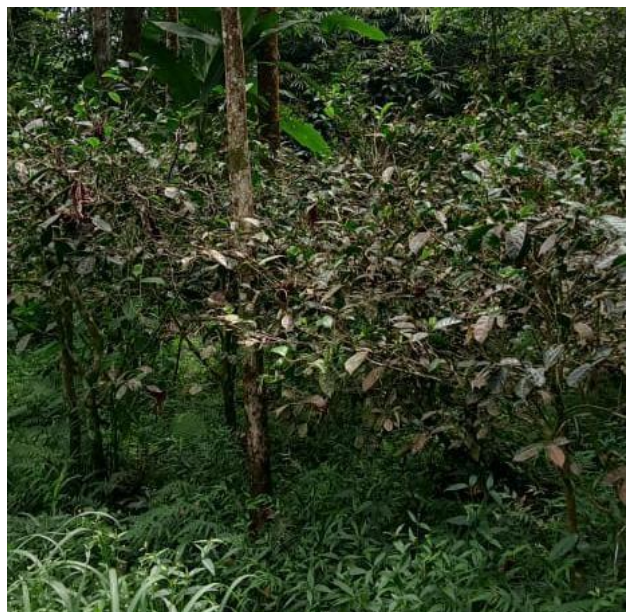
Gambar 1. Kondisi awal kebun teh di Turgo

kebun. Kedua, pre-test dan post-test sederhana untuk mengukur perubahan pengetahuan peserta mengenai GAP dengan menggunakan borang berisi 25 pertanyaan yang terbagi dalam 5 subbagian. Ketiga, wawancara singkat dan diskusi kelompok untuk menggali respons, hambatan, dan rencana penerapan hasil pelatihan. Keempat, dokumentasi foto kegiatan dan catatan lapangan. Data kuantitatif dianalisis secara deskriptif menggunakan rerata skor, persentase peningkatan, dan perbandingan sebelum-sesudah.